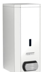
DJ0031C Acabado brillante