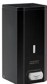
DJ0031B Acabado negro mate