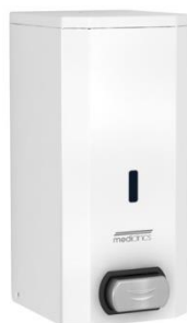
DJ0031 Acabado blanco