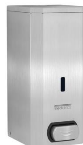
DJ0031CS Acabado satinado